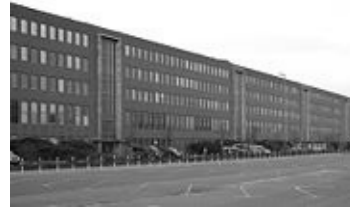
Das VW-Werk in Stöcken beschäftigt rund 11.500 Menschen

Darüber hinaus ist es auch wichtig, dass es eine nachhaltige Industriepolitik im Sinne dieses Kontextes gibt, die eine zukunftsfähige Restrukturierung beinhaltet und nicht nur auf aktuelle Probleme reagiert. Dies ist für den Automobilstandort Niedersachsen von großer Bedeutung.